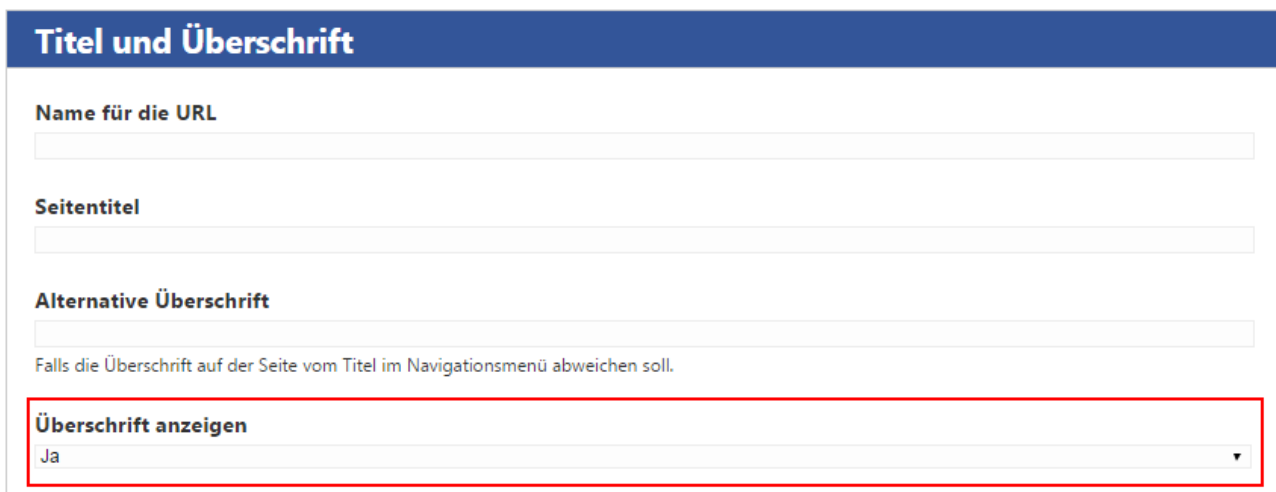
Abbildung 1: Neue Option "Überschrift anzeigen"