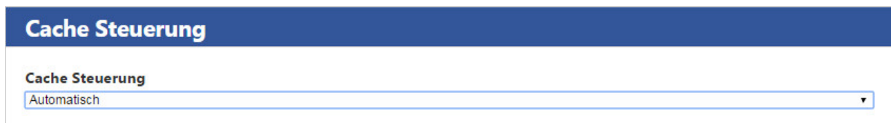
Abbildung 6: Neue Option "Cache Steuerung"

Die Seite wird niemals gecacht, sondern bei jedem Aufruf neu generiert.