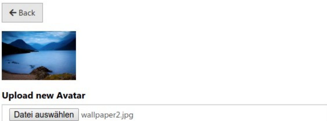
Abbildung 2: Avatar hochladen

User können nun ein Profilbild in Ihrem Profil hochladen.