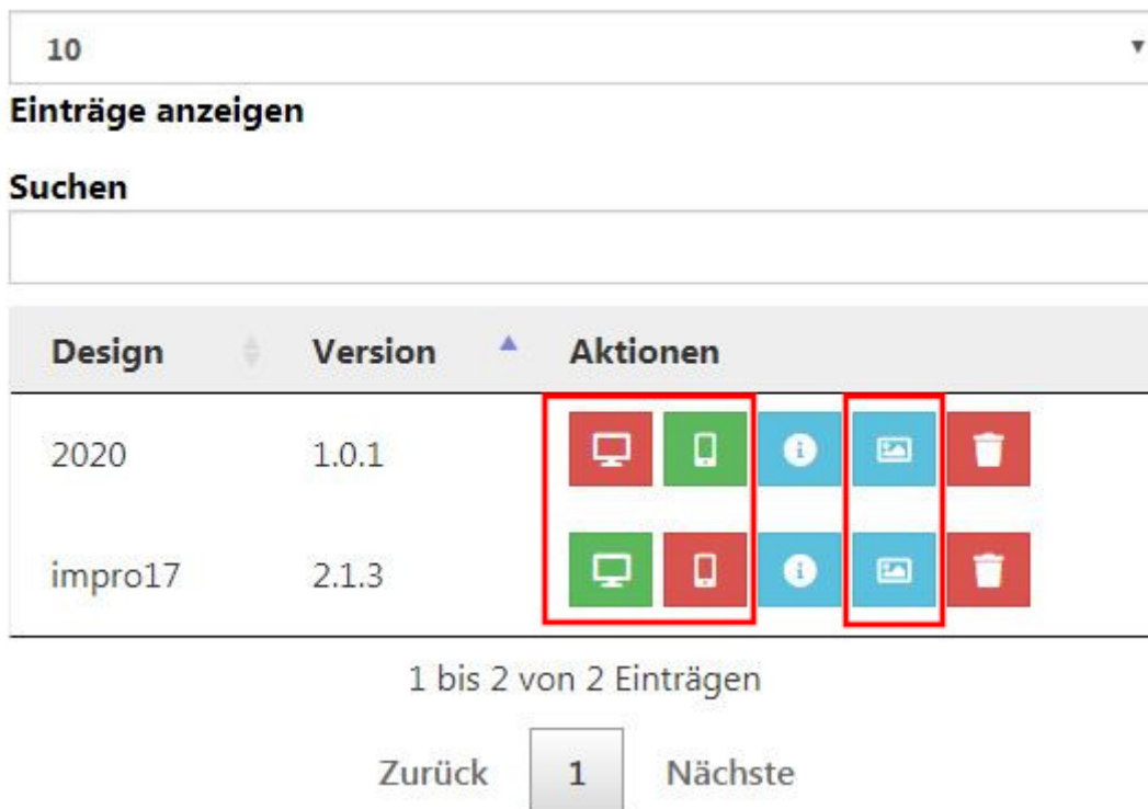
Abbildung 7: Neue Icon-Buttons