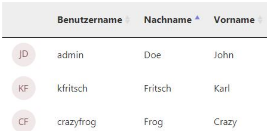
Abbildung 1: Thumbnails mit Initialen

Bei Usern, die kein Avatar hochgeladen haben, wird ein Avatar aus den Initialen von Vor- und Nachname generiert.