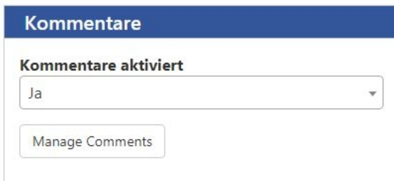
Abbildung 2: Tab "Kommentare" in der "Seite bearbeiten" Ansicht

Wenn für den Inhalt bereits Kommentare vorhanden sind, wird außerdem der Button „Kommentare verwalten“ angezeigt. Dieser führt zur Kommentarverwaltung welche alle Kommentare die zu diesem Inhalt verfasst wurden anzeigt.