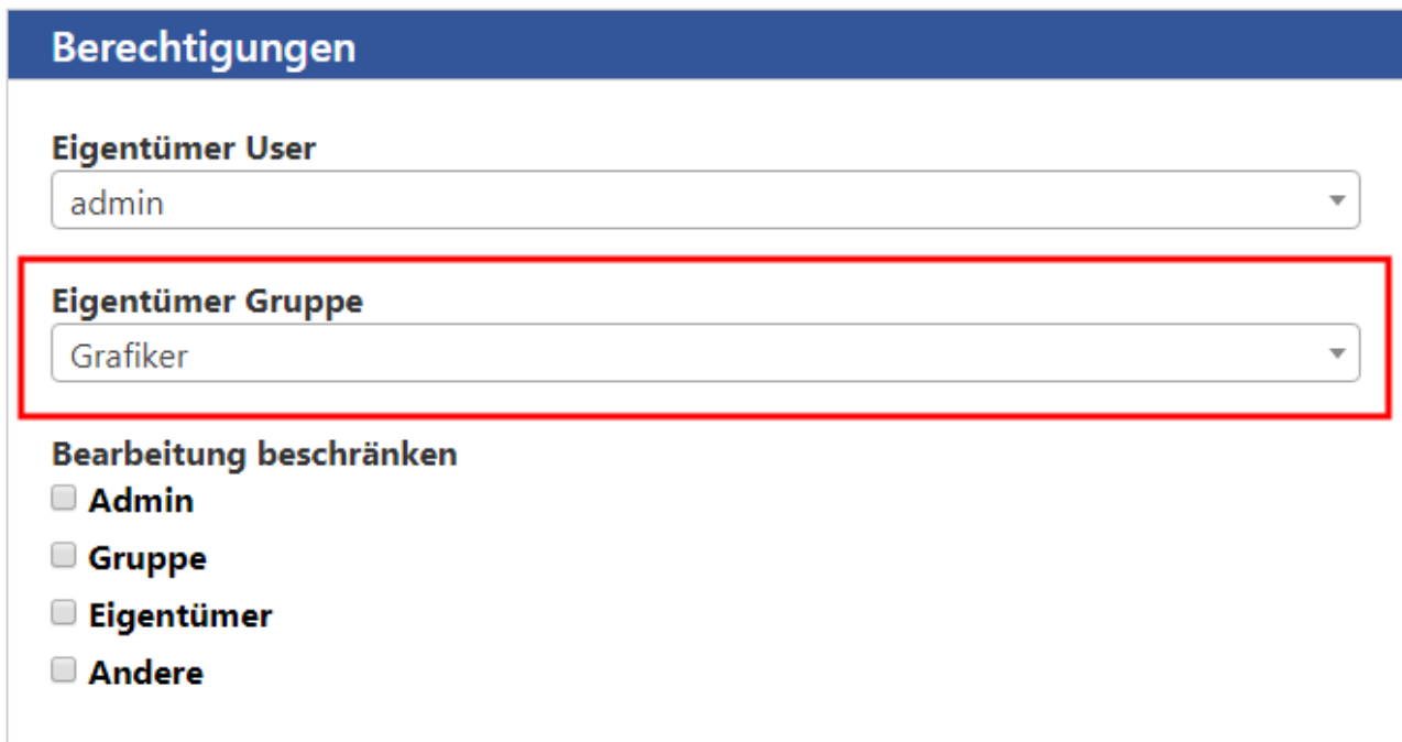
Abbildung 2: Screenshot: Eigentümer Gruppe einer Seite

Die Bearbeitungsbeschränkung „Gruppe“ bezieht sich nun auf die dort ausgewählte Gruppe, statt wie bisher auf die Gruppe des Benutzers. Bei neuen Datensätzen wird die Gruppe des Erstellers eingetragen.